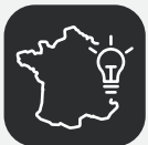
Conçu en France